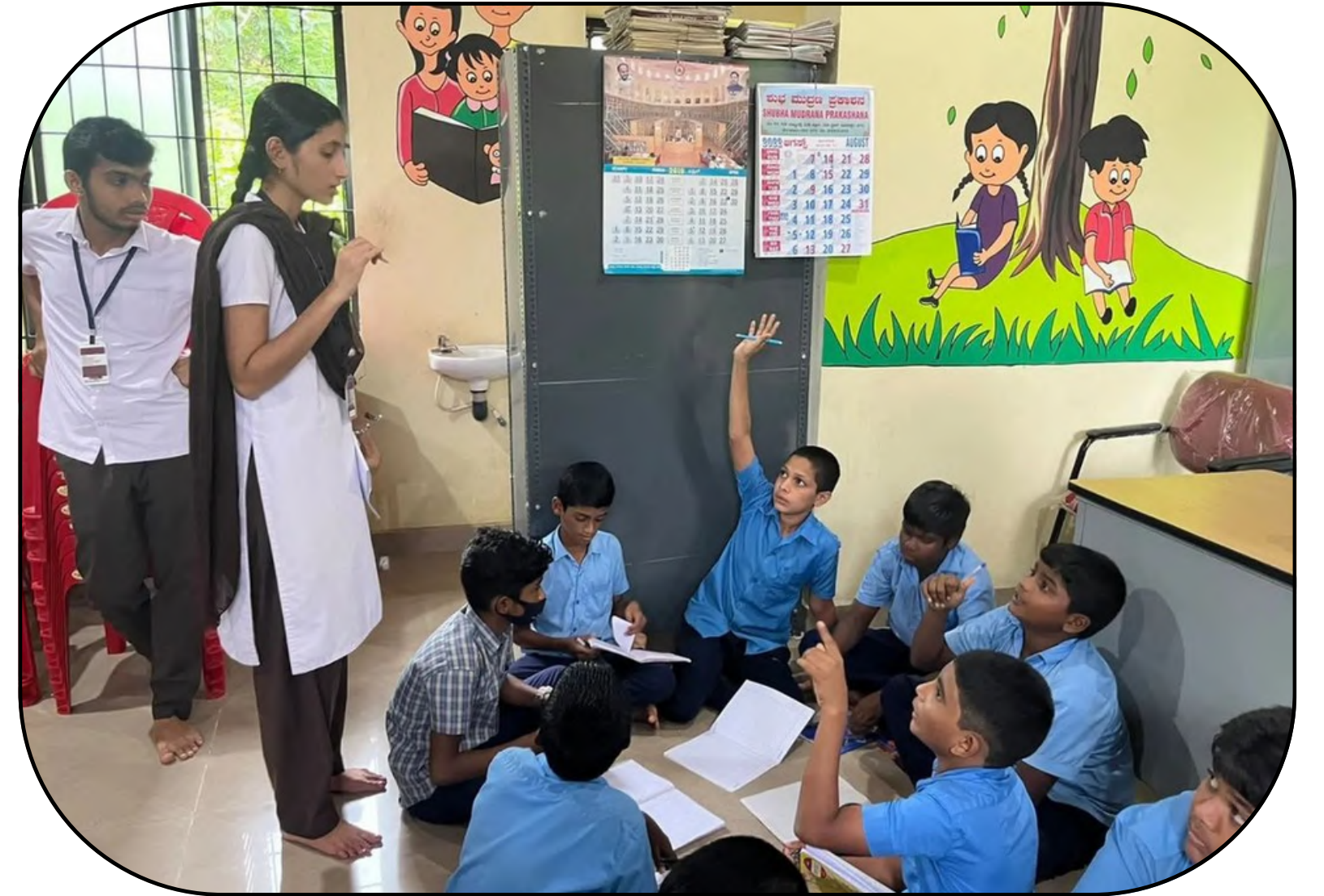
Kabaka gram panchayat, Puttur , Dakshina kannada