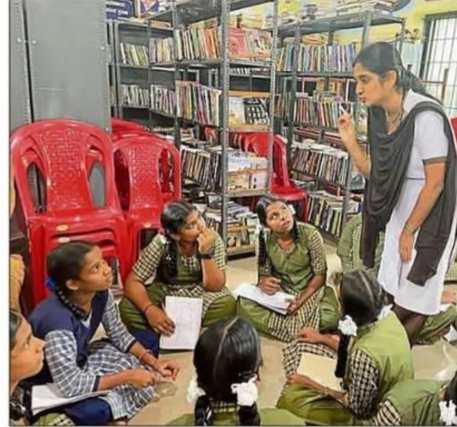
ಪುತ್ತೂರು ತಾಲ್ಲೂಕಿನ ಕಬಕದ ಗ್ರಂಥಾಲಯದಲ್ಲಿ ವಿಶೇಷ ತರಗತಿಯಲ್ಲಿ ಪಾಠ ಕಲಿಯುತ್ತಿರುವ ಮಕ್ಕಳು

'ಸರ್ಕಾರಿ ಶಾಲೆಯ ಮಕ್ಕಳನ್ನು ಸ್ಪರ್ಧಾತ್ಮಕವಾಗಿ ಬೆಳೆಸಿ, ಅವರ ಬೌದ್ಧಿಕ ಮಟ್ಟ ಹೆಚ್ಚಿಸುವ ಜತೆಗೆ, ಜೀವನ ಕೌಶಲ ಕಲಿಸುವ, ತಂತ್ರಜ್ಞಾನದ ಜ್ಞಾನ ಬಿತ್ತುವ ಆಶಯದೊಂದಿಗೆ