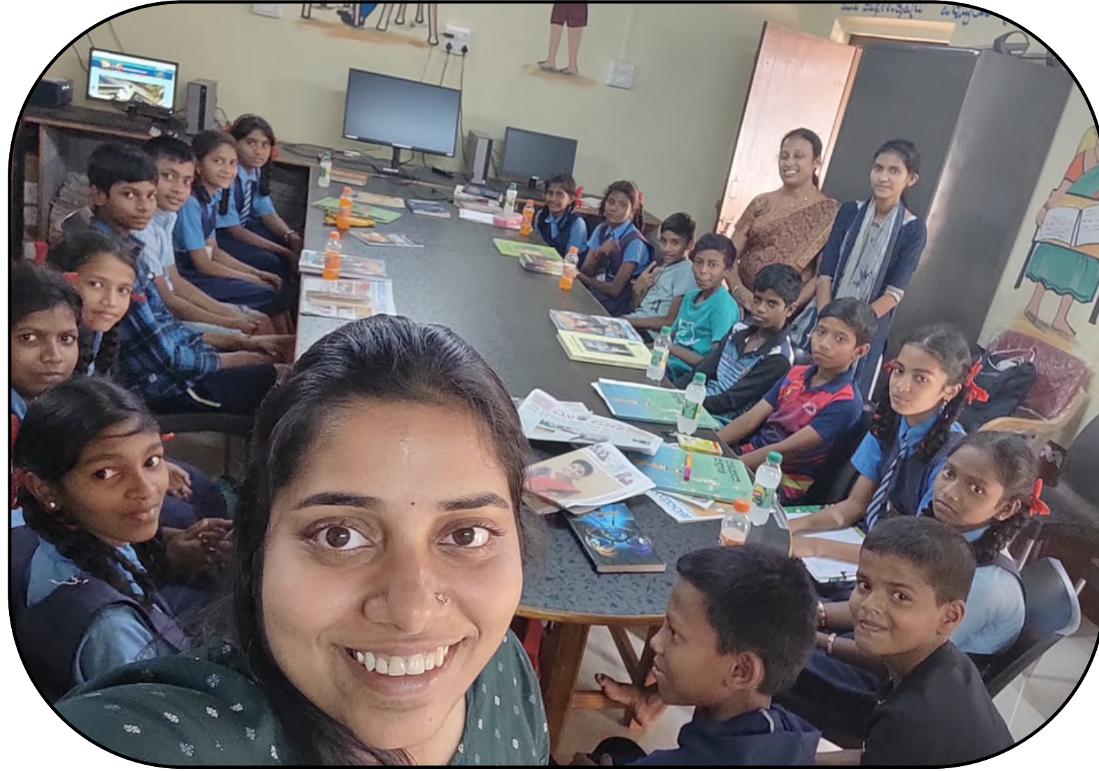
Aversa gram panchayat of Ankola, Uttara Kannada District